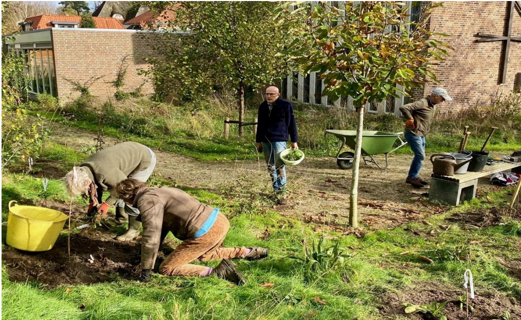
Er zijn werkers en opzieners....

We kunnen nog steeds tuinmannen en -vrouwen in de Johanneshof gebruiken. Het is heel gezellig met elkaar en we leren veel over wat groeit en bloeit. Door goede verzorging wordt onze hof steeds mooier. Elke eerste zaterdagochtend van de maand wordt er in ieder geval gewerkt.