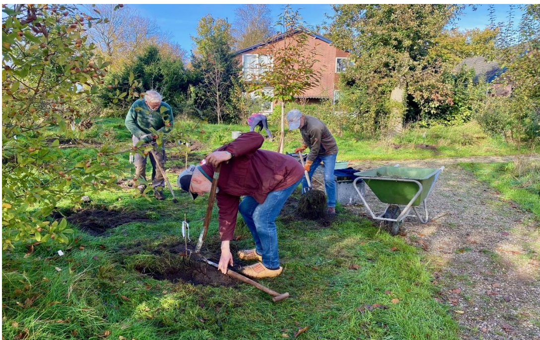
Wie zijn deze werkers?

Afgelopen zaterdag heeft de tuinwerkgroep nieuwe plantjes gezet, vooral op de heuvel aan de Julianalaan-zijde. Door de nieuwe aanplant proberen we daar het vergrassen in te perken. Binnenkort gaat het heemtuingedeelte gemaaid worden. Dat gebeurt aan het einde van het herfstseizoen zodat de planten tijd hebben om nog zaden te geven en te kunnen afsterven. Insecten en vogels hebben nog een schuilplaats.